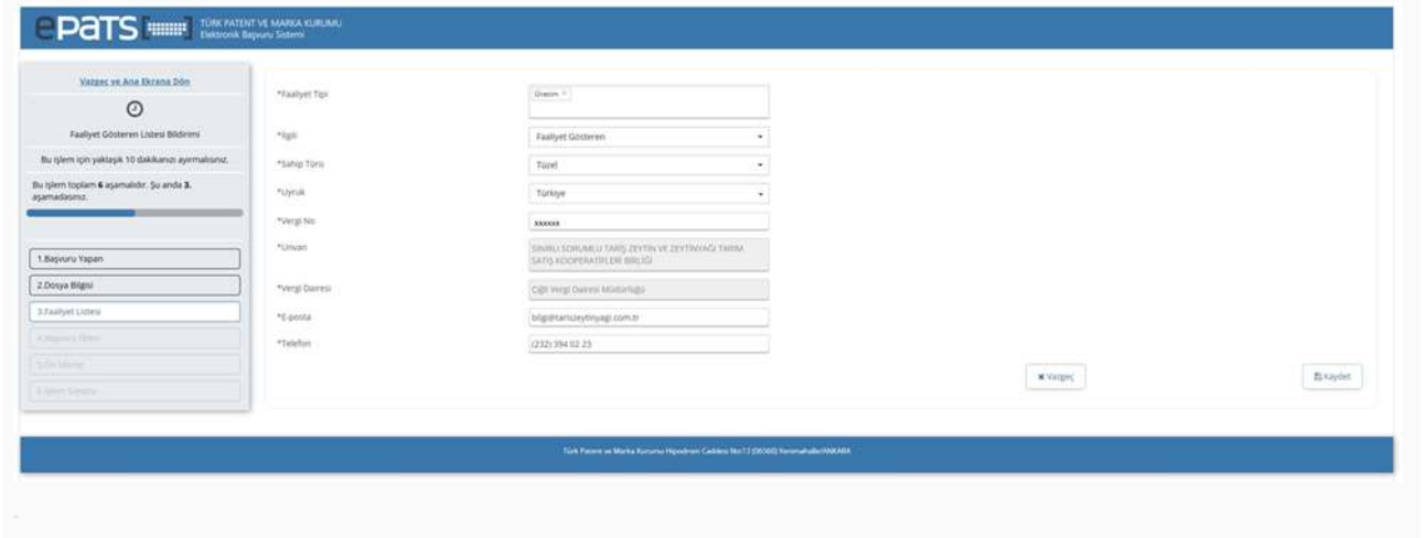
Ekran 4 — Faaliyet gösteren kayıt formu (örnek: Tüzel kişi, Üretim)