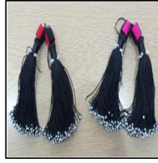
Şekil 10. Kuşak tokasına ait görsel

Kuşak tokası; bel kısma sarılan kuşağın arka görünümündeki uç kısımlarına görsel zenginlik katmak için dikilen boncuk ve iplerden oluşan aksesuar amaçlı püsküldür.