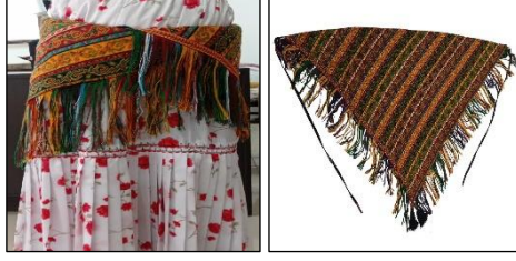
Şekil 6. Kuşağa ait görsel