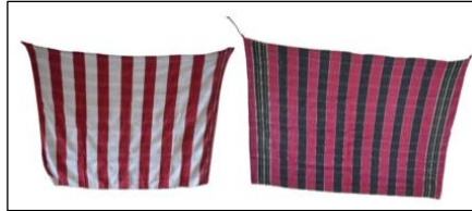
Şekil 8. Peştamala ait görsel

Kuşağın üstüne bel kısmından sarılır. Peştamallar yukarıdan aşağı dik eşit şerit halinde düz desenlidir. Kuşağın üstüne bağlamak için uçlarına bezden ince şerit dikilir. Peştamal uçları bel bölümünün sol yanına gelecek şekilde bağlandıktan sonra sağ orta uç kısmından kuşağın bel bölümüne doğru katlanır. Böylece fistan ve kuşak tokasının görünmesi sağlanır. Genelde beyaz-bordo ve siyah-bordo renkte peştamallar tercih edilir.