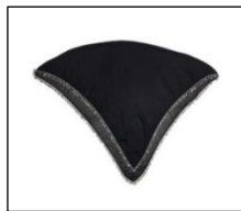
Şekil 2. Çember (Cember)'e ait görsel

Çember ya da halk arasında “çember” olarak adlandırılan desenli ya da sade başörtüleri kullanılır. Kare şeklinde olan çember 100 x 100 cm kenar uzunluğuna sahiptir. Oyalarına ve kullanım şekline göre alın kısmına bağlanan alın çemberi, pullu çember olarak belirtilmektedir. Çemberin etrafında çeşitli renklerde pul ya da boncuklar kullanılır. İğne oyası ile kenarları isteğe göre işlenebilir. Coğrafi sınırda çemberin bağlanma şekilleri arasında “guşkuyruk”, “gukul” yer alır. Boğazın görünmemesi için çember boğazın altından bağlanır. Boyun kısmı görünecek şekilde ise guşgurruk veya gugul biçiminde bağlanır.