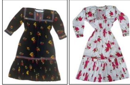
Şekil 3. Fistana ait görsel

Şalpaazarı'nda tek parça kadın giysisi anlamında kullanılan fistan, coğrafi sınırdaki "kırmalı fistan" olarak adlandırılır. Bu isim eteğindeki kırmalardan gelir. Fistanın en belirgin özelliği, yaka, kol manşetleri ve etek kısmındaki nakışlı süslemelerdir. Günümüzde tüm fistanlar nakışlı olup eski dönemde bol olan etek kısmı artık daraltılmış, bolluk hissi kırmalar ile sağlanmıştır.