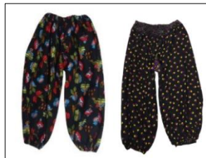
Şekil 5. Dizliğe ait görsel

Şalvara benzeyen dizlik, fistanın altına giyilir ve paça boyu diz altındadır. Dizliğin bel kısmına ve paça uçlarına lastik takılarak giyilir. Fistanın altına giyilerek fistanın kabarık durmasını sağlar.