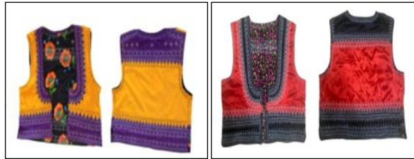
Şekil 4. Yeleğe ait görsel

Fistanın üzerine günümüzde astarlı bir yelek giyilir. Yeleğin astarı genellikle renk tonuna uygun pazen veya divitin kumaşından. Dış yüzeyi ise saten kumaşla dikilir. Göğse kadar oval bir açıklığı olan yelek, beli kapatmaz ve yakasında düğme veya bağ bulunmaz. Yaka ve alt kısımları yöre terzileri tarafından elle gezdirilerek makineyle nakışla işlenir. Yelek; 2 adet ön ve 1 adet arka kısım olmak üzere 3 parçadan oluşur. Genellikle jarse, krep, saten ve ipek tarzı kumaşlar kullanılır. Ana kumaş ve üzerine pervaz için kullanılacak kumaş 50 cm; iç yüzeye eklenen astar kumaş divitin ise yaklaşık 1 metredir.