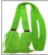
Şekil 9. Bel bağına ait görsel

Aksesuar olarak kullanılan bel bağı, kılık bağından farklı bir yerde, fistanın üzerine gelecek şekilde sarılır, taşıma veya bağlama ipi olarak da kullanılır. Bel bağında simli ya da sade renk akrilik ip kullanılır, bel kısmında kemer görüntüsü verir ve bedenin sol tarafına bağlanarak sarkıtılır. Giyilen yeleğin ana renkleri ile genellikle uyumludur.