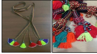
Şekil 7. Kılık bağına ait görsel

Bedenin ön kısmında bağlanan uçlar, püskül ve renkli boncuklarla süslenen bağ, 1,5 cm eninde ve 2,5-3 m uzunluğunda ince bir dokumadır. Aksesuar olarak kullanılan bu kılık bağı, bele sarılan peştamalin üzerine bağlanır. Bağın uçları, belin sağ ve sol arka kenarlarından sarkıtılarak görünür hale getirilir.