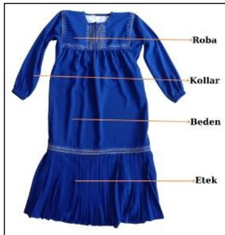
Şekil 10. Fistanın bölümlerine ait görsel