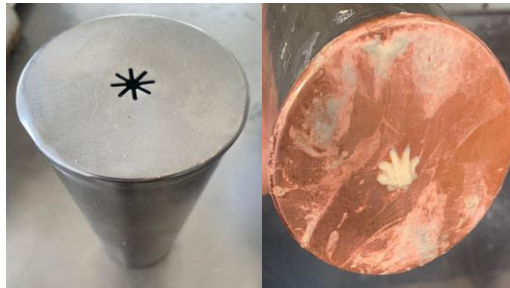
Şekil 1: Hatay Müşebbek Tatlısının kalıbı

Hatay Müşebbek Tatlısının hamuru, ortasında 8 uçlu yıldızlı bir şekil bulunan krom veya bakır dolum haznesi olan ve coğrafi sınırdaki tulumba adı verilen özel bir kalıptan sıkılır. Tatlının üzerinde sarmal kanallar oluşur. Bu kanalların örgülü bir kafesi andırması nedeniyle de, Arapça "örgü ağ" vb. bir anlama gelen müşebbek kelimesi, Hatay Müşebbek Tatlısı adında yer alır.