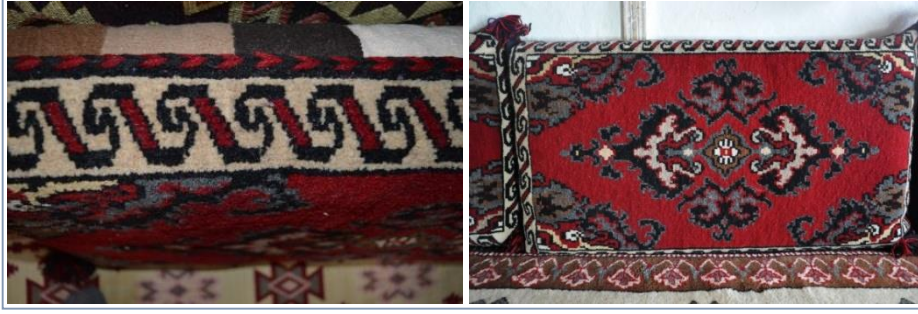
Şekil-7: "Su yolu" motifi kullanılmış Akçadağ Halıları