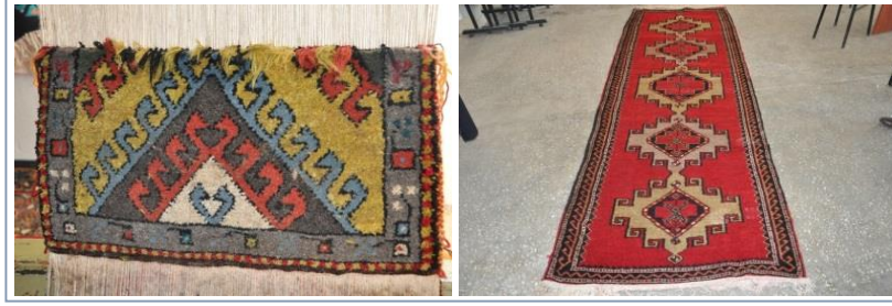
Şekil-12: "Akrep/Nık" motifi kullanılmış Akçadağ Halıları