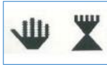
Şekil-9: "El-parmak" motifi