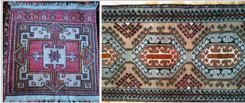
Şekil-4: “Koç boynuzu” motifi kullanılmış Akçadağ Halıları