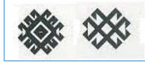
Şekil-11: "Akrep/Nık" motifi