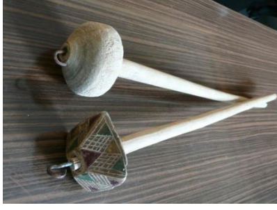
Şekil-16: Makas, Kirkit ve Dişkit