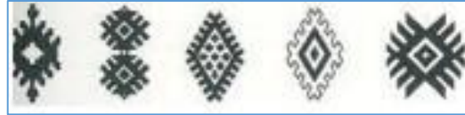
Şekil-8: "Pıtrak" motifi