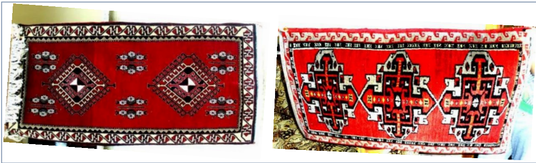
Şekil-14: "Damga/İm" motifi kullanılmış Akçadağ Halıları