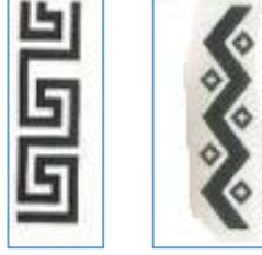
Şekil-6: "Su yolu" motifi