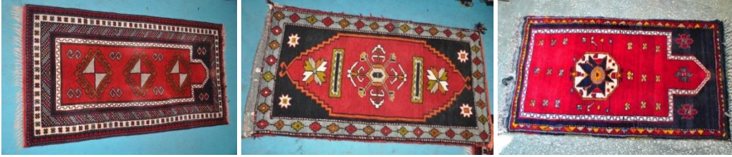
Şekil-15: Mihraplı/camili zemin kullanılmış Akçadağ Halıları

dokuma kompozisyonlarına, dikey ya da yatay hatlar ve mihraplı kompozisyonlar hâkimdir. Kompozisyonlar stilize edilmiş geometrik ve bitkisel bezemeler kullanılarak, simetrik düzende oluşturulmaya çalışılmıştır. Mihraplı ve mihrapsız zemin olduğu gibi, göl ya da göbek adı verilen ortada yer alan büyük desenlerin etrafı diğer küçük motiflerle dolgulanmış zeminler de vardır. Mihrap türünde de mihrap iç çeperleri küçük çiçeklerle bezenir. Bazı örneklerde mihrap basamaklarının çengel şekilli motiflerle süslü olduğu görülür. Mihrapsız halılar da mevcuttur. Zemin, değişik renkli, sekiz kollu ve altı kollu yıldızlar, U ile V şekillerine benzeyen desenler, koçboynuzu motifleri ve şaşırtmalı çiçek desenleriyle bezenir. Halıların bazılarında zemin üç veya dört adet kare şekilli dikey yerleştirilmiş göbeklerle dolgulaşır. Genelde göbekler birbirinden göz motifi veya zikzak şekilli kıvrım desenleriyle ayrılmaktadır.