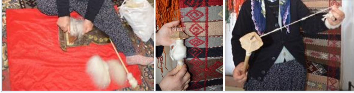
Şekil-18: Yünün taranması ve eğilmesi