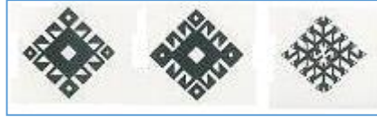
Şekil-13: "Damga/im" motifi