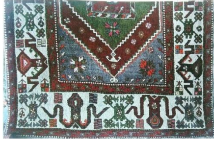
Şekil-1: Kara Bulut motifli Yuntdağı El Halısı