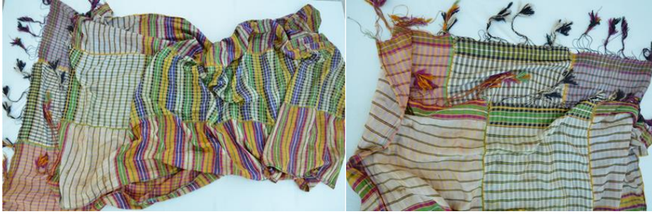
Şekil 10. Trablus kuşığının görünümü

Trablus kuşığı 4 m uzunluğunda ve 90 cm genişliğinde olup dikdörtgen şeklindedir. İpek kumaştan dokunur. Trablus kuşığının dokunmasında 425 sayı ile coğrafi işaret tescilli Bursa İpeği / Bursa İpek İpliği tercih edilir.