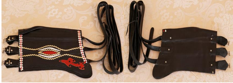
Şekil 14. Silahlığın önden ve arkadan görünümü

Seymenlerin kuşaklarının üzerine takılan silahlık, meşin deriden yapılıdır ve 8 gözlü olur. Silahlığın bir kenarında üç toka, diğer kenarında ise ikisi uzun bir kısa olmak üzere üç kayış kemer (kolon) vardır. Uzun olan kayış kemerlerin boyları en az 140 cm, kısa olan kayış kemerin boyu ise en az 120 cm'dir. Siyahlığın yan tarafında bulunan kemer ve kemer tokaları vasıtasıyla silahlık bele sıkıca bağlanır ve üzerine bulunan 8 gözlü olan bölümlere de aksesuarlar takılır. Silahlığın üst kenar kısımları ikili veya üçlü deriden saç örgüsü süslemelidir. Silahlığın orta kısmında simli sutaşından ve deriden yapılmış olan süsleme olup sol alt yan kısmında ejderha deseni kullanılır. Seymenin belinin ön kısmında kullanılan silahlığın boyu, kayış kemer ve toka kısmı hariç en az 24 cm en fazla 28 cm olması gerekir. Silahlığın altı içeriye, üstü ise dışarıya doğru olmalıdır. Silahlığın üretiminde; tarihi, 13. yüzyılda Anadolu'da yaşayan ahilerin dericilik faaliyetlerine ve Ankara'da kurulan "tabakhane" adı da verilen büyük debbağhanelere dayanan deriler kullanılır. Silahlık yapımı ustalık becerisi gerektirir.