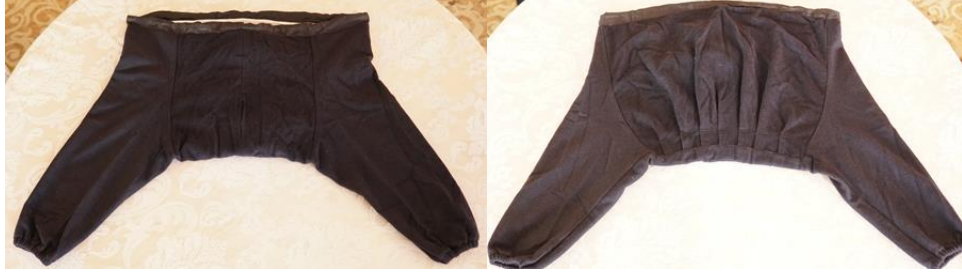
Şekil 7. Nakışsız zıvganın önden ve arkadan (pileli kuyruk kısmı) görünümü

Genellikle lacivert, kurşuni veya krem renkte olup çuha kumaştan yapılır. Bileğe kadar uzun ve dar paçalı, arkası kuyruk oluşturacak derecede bol ve dökümlü olur. Arka kuyruk kısmı kırmalı (pileli) şeklindedir ve en az 12 tane olup en fazla 24 kırması bulunur. Paça kısmı diz çorabı üzerine kadar muntazam bir şekilde kıvrımlar oluşturacak biçimde sıvanır. Bel kısmına 4 m uzunluğunda fitilli bağ takılır. Zıvga bu bağ ile belden bağlanır. Zıvganın ön kısmında 16 veya 18 cm uzunluğunda yırtmacı olur. Bu yırtmaç düğme veya fermuar ile kapatılır. Zıvganın üzeri nakışsız olabildiği gibi paça ve yan tarafları kordon tutturma nakışı ile de süslenebilir. Zıvganın, dikiş ve nakış işi ustalık becerisi gerektirir.