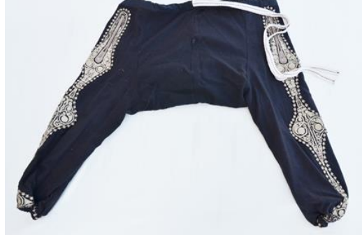
Şekil 8. Nakışlı zıvganın önden görünümü