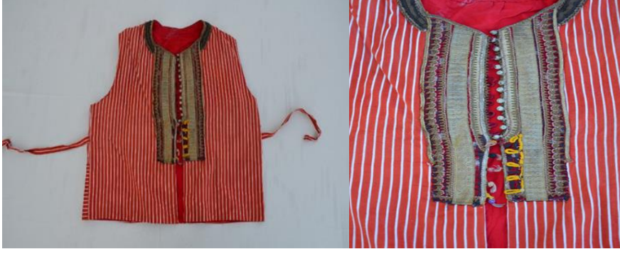
Şekil 4. Harçlı yeleğin önden görünümü