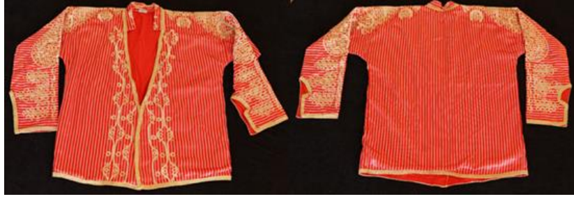
Şekil 1. Osmanlı işliğinin önden ve arkadan görünümü