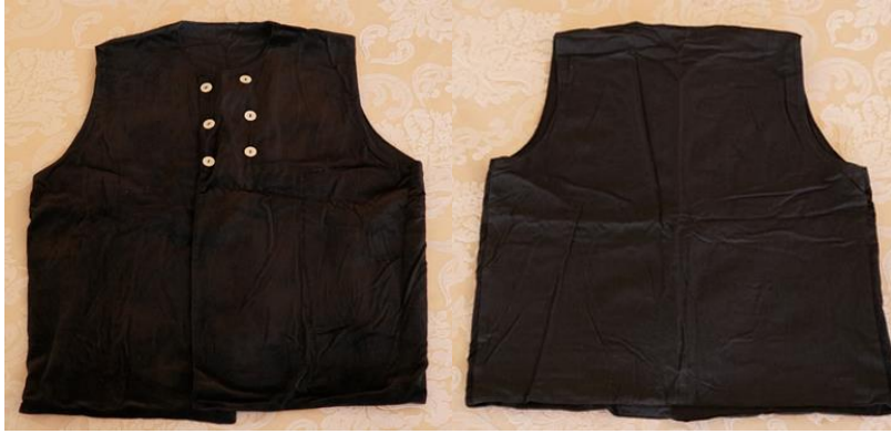
Şekil 5. Kadife / çuha yeleğin önden ve arkadan görünümü

Kadife / çuha yelek, harçlı yelek kullanılmadığında, Osmaniye işlik altına giyilir. Kadife / çuha yelek kolsuz, kapalı yakalıdır ve önden birbiri üstüne binecek şekilde kapanır. Kapandığında düğmeler iki sıra oluşturur, bu düğmeler çift sıra sedef düğmedir. Genellikle siyah, lacivert, bordo, koyu yeşil renklerde çuha veya kadife kumaştan yapılır.