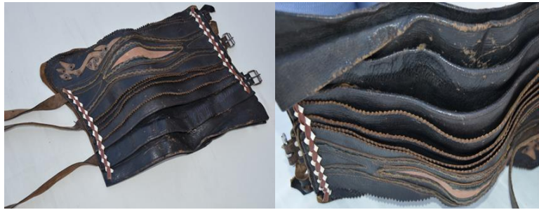
Şekil 15. Silahlığın üstten görünümü