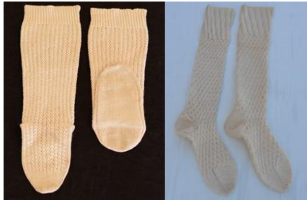
Şekil 6. Diz çoraplarının önden ve yandan görünümü

Diz çorapları ajurlu veya düz örgü şeklinde tiftikten yapılır. Diz çoraplarının boyu dize gelecek uzunlukta olmalıdır. Çorap koncuna bağlı bulunan ince bağı ile sıkıca dize bağlanır. Diz çoraplarında kullanılan tiftik ip, 802 sayı ile coğrafi işaret olarak tescilli Ankara Tiftiğinden yapılır.