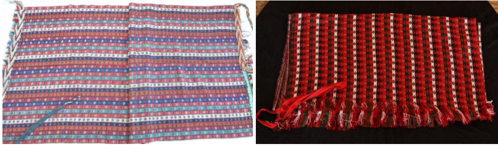
Şekil 9. Bademli şal kuşağın görünümü

Ankara Seymen Kıyafetinin / Ankara Seğmen Kıyafetinin önemli bir parçası olan ve desenin bademli olmasından dolayı adını bu desenden alan bademli şal kuşağın uçları hafif püsküllüdür. Kuşağın bele bağlanmasında kullanılmak üzere kuşağın bir kenarına dikilen fitil ip, kuşak bele sarıldıktan sonra kuşağın üzerinden bağlanır. Bademli şal kuşak yünden dokunur. 2,5 m uzunluğunda, 80 cm genişliğinde ve dikdörtgen şeklindedir. Bademli deseninde değişiklik olmayıp renkleri farklılık gösterebilir.