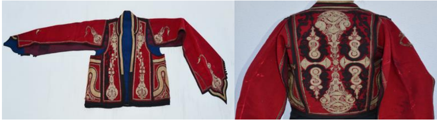
Şekil 3. Cepkenin önden ve arkadan görünümü

Cepken (kartal kanat), çuha kumaştan yapılır ve üzeri sim iplerle kordon tutturma tekniği ile nakışlıdır. Boyu belden yukarı göğüs hizasında kalacak şekilde kısa ve birbiri üzerine kavuşmayacak şekilde dar ve sarkıktır. Uzun olan kolları bilek hizasında hafifçe yırtmaçlı, bir parmak yakalı ve içi astarlıdır. Lacivert, siyah, koyu kırmızı, mavi renklerde dir. Cepkenin, dikiş ve nakış işi ustalık becerisi gerektirir.