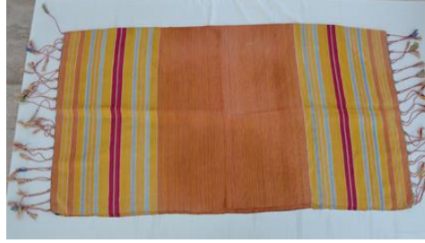
Şekil 11. Kefiyenin görünümü