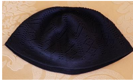
Şekil 12. Takkenin görünümü

Takke, lacivert veya siyah renkte kadife kumaştan olup kefiyenin başta sabit şekilde durması için kefiyenin altına takılır.