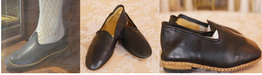
Şekil 13. Yemeninin farklı açılardan görünümü

İki çeşit yemeni bulunur. İlk yemeninin altı kösele, üstü deridir. Kösele ile derinin birleştiği dikiş yerinde krem ip dikişi belirgindir, ön kısmı ise geriye doğru hafif kıvrıktır. İkinci yemeninin altı köseledir ve üstü meşin (yumuşak) deriden yapılıdır. Rengi siyahtır, bileğin hemen altında biter ve küçük ince bir topuğu vardır. Kösele ile derinin birleştiği yerde krem rengi ip ile dikişi belirgindir. Ucu hafif yuvarlaktır. Yemenin üst kısmı yarım dillidir. Yemeninin üretiminde; tarihi, 13. yüzyılda Anadolu'da yaşayan ahilerin dericilik faaliyetlerine ve Ankara'da kurulan "tabakhane" adı da verilen büyük debbağhanelere dayanan deriler kullanılır. Yemeni yapımı ustalık becerisi gerektirir.