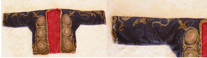
Şekil 2. Camadanın ön ve kol görünümü

Çuha kumaştan yapılır ve Osmaniye işlik üzerine giyilir. Boyu belden yukarı, göğüs hizasında kalacak şekilde kısa ve önünde birbiri üzerine kavuşmayacak şekilde dardır. Uzun olan kolları bilek hizasında düz veya hafifçe yırtmaçlı, bir parmak yakalı, üstü baştanbaşa farklı desende kordon tutturma nakış tekniğiyle sim işlemeli ve içi astarlıdır. Camadan önemli günler haricinde giyilir. Camadanın, dikiş ve nakış işi ustalık becerisi gerektirir.