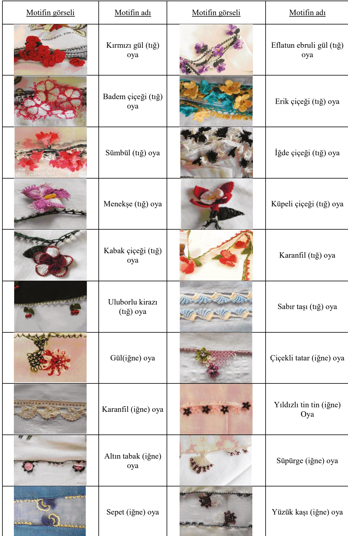
Tablo 1. Uluborlu Çeki Oyasında kullanılan motifler ve adları